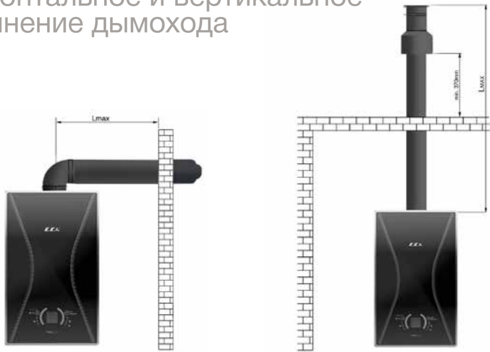
Горизонтальный коаксиальный дымоход

Макс.расстояние L с одним коленом: 10 м, 60/100 мм Макс.расстояние L с одним коленом: 20 м, 80/125 мм